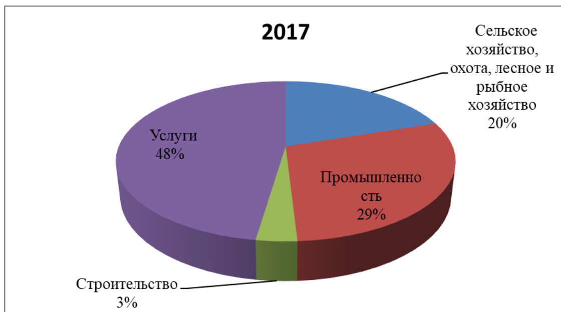
Рис. 2. Структура экономики Сирии по отраслям в 2017 г., % от ВВП.

налогов значительно сократились. Государственный бюджет столкнулся с резким ростом бюджетного дефицита, поскольку текущие расходы растут. В результате общий государственный долг увеличился, и главным инструментом финансирования национальной экономики стал внутренний долг. Лишь с 2017 г. наметился рост ВВП, причем таким образом, что в 2018 г. его объем по стоимости не достиг даже уровня 2000 г.